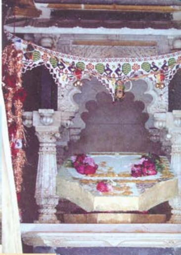
ઘેટીપાગની દેરી તથા ઋષભદેવના પગલાં